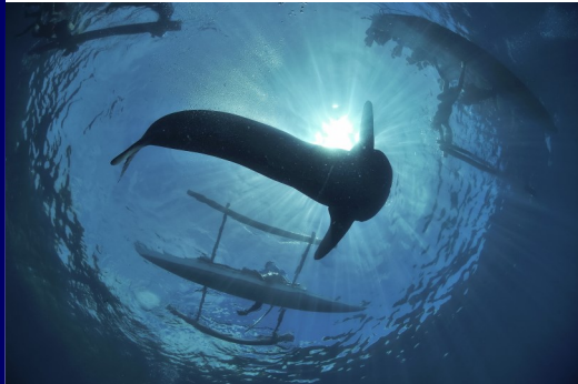
Photographie sous-marine, splendeur et secrets - Pascal Kobeh