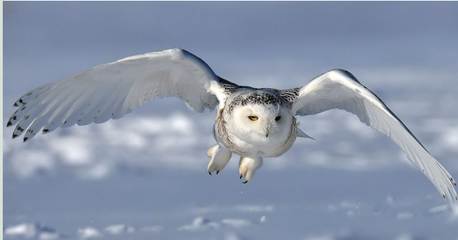
Harfang des neiges