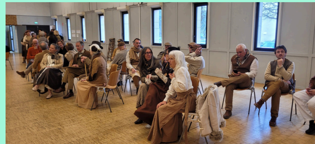
Costumes réalisés par la section Mode pour le Labopéra _ “La Bohème” de Puccini